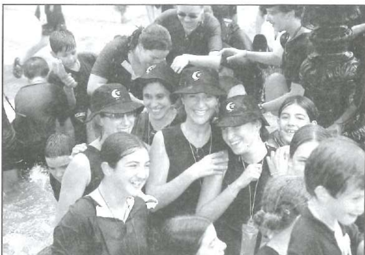
Marroques a la Font de l'Asil 24-VIII-02

- Demanar a les filaes que augmente el protagonisme dels xiquets en el Desfile dels Xiquets. Una proposició seria que els festers/eres majors acompanyaren als xicotets als costats aplaudint-los i donant-los ànims durant tot el recorregut.