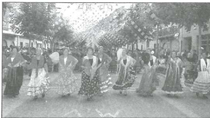
Esquadra REFORÇ CONTRABANDISTES 25-VIII-02