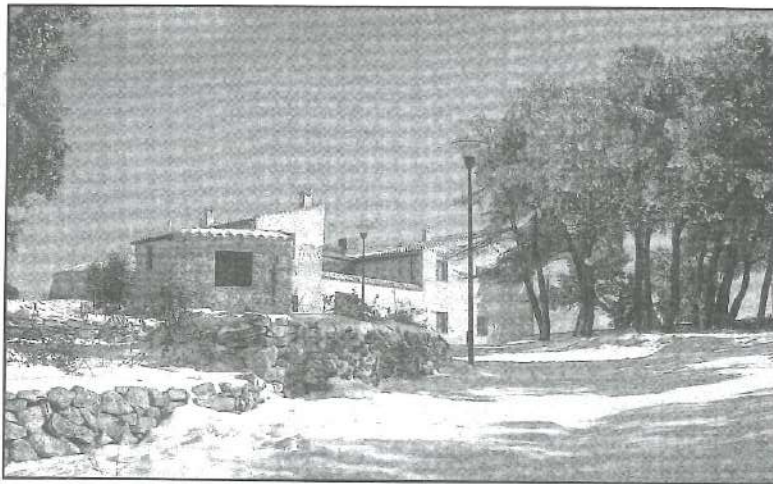
El Pou de la Neu

Entrada la vesprada, va acabar esta jornada de treball i reflexió entre l'Ajuntament i l'Associació amb la intenció de repetir-la més sovint, fins i tot alguns van apuntar la idea que havia de fer-se una vegada a l'any.