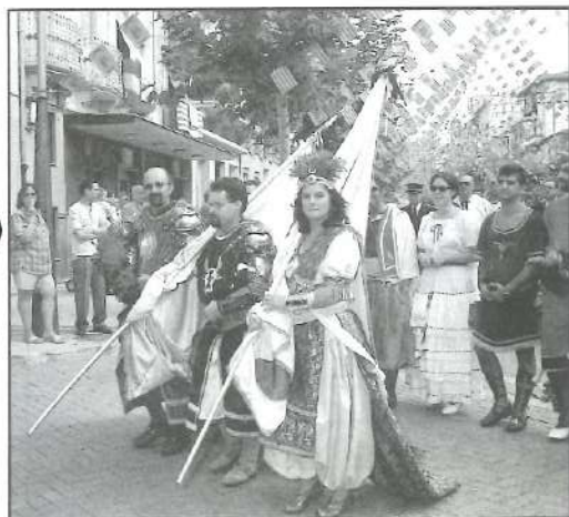
La dona sempre ha sigut festera