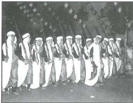
19-VIII-2000 - Moros Verds en l'Entrà

D issabte passat, 25 de gener de 2003, la filà Moros Verds va convocar la seua Assembla General Ordinària del primer semestre de 2003. La reunió va tenir lloc en la seua kàbila sítia en el carrer Terradets núm. 15, a partir de les 17,45 hores en segona convocatòria. Els punts que van tractar foren la lectura i aprovació de l'acta de l'última assemblea, tancament