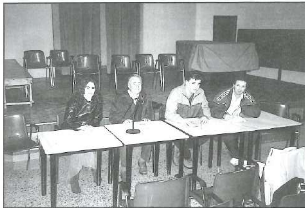
26-I-2003 - La Junta Electoral

En pròximes reunions de la Junta Directiva es crearan les comissions de treball i es nomenaran els seus ponents.