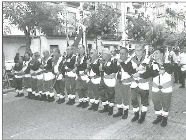
24-VIII-2002 - L'Entrà

ja les forces ha de ser més fluida. Les noves tecnologies han fet la seua aparició en les nostres llars i, com no, en les nostres festes, així es vol aconseguir que el mateix fester es puga comunicar des del caliu de la llar amb l'oficina de la nostra associació i, fins i tot, es puga inscriure en les distintes activitats organitzades per la nostra associació. Per a oferir la màxima informació s'ha creat una pàgina web molt ambiciosa i extensa, perquè arrebega des de la història de les nostres festes, tots els actes, els ca-