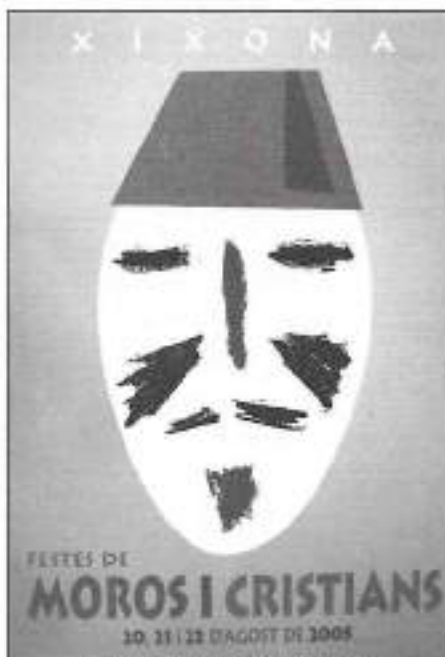
Cartel Anunciador de les festes 2005

Per a comprovar el seguiment d'aquesta exposició enguany s'ha realitzat una xicoteta estadística. La mostra va ser visitada per 341 persones durant els 5 dies que va estar oberta. La mitjana de visitants per dia es va situar en els 57 (56,83), sent inferior a la de l'exposicions de mans i brodats festers. No obstant, si comparem les dades d'aquesta última exposició només els