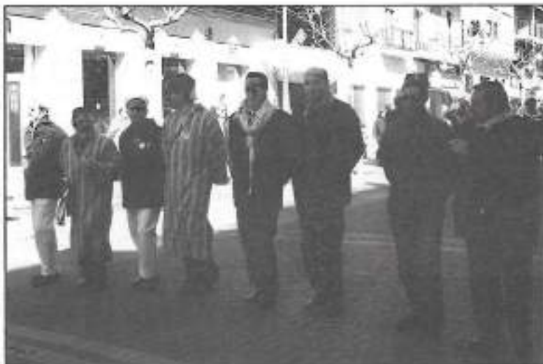
Desfilé de la Federació 26-2-2005

El divendres la música festerà es va apoderar de la nostra ciutat amb un memorable concert de l'Agrupació Artísticomusical El Treball. En aquest marc incomparable es van fer entrega dels trofeus festers.