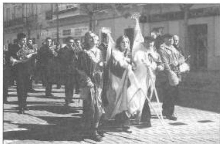
Capitans i capitana i abanderada de festa en el Desfile de la Federació 26-2-2005

les nostres festes, però no necessàriament ha de ser nascut a Xixona. En fi un acte en què s'han obtingut una sèrie de conclusions que hauran de ser analitzades per la Junta Directiva per poder-se portar a la pràctica, llàstima que l'assistència de públic fóra minoritària.