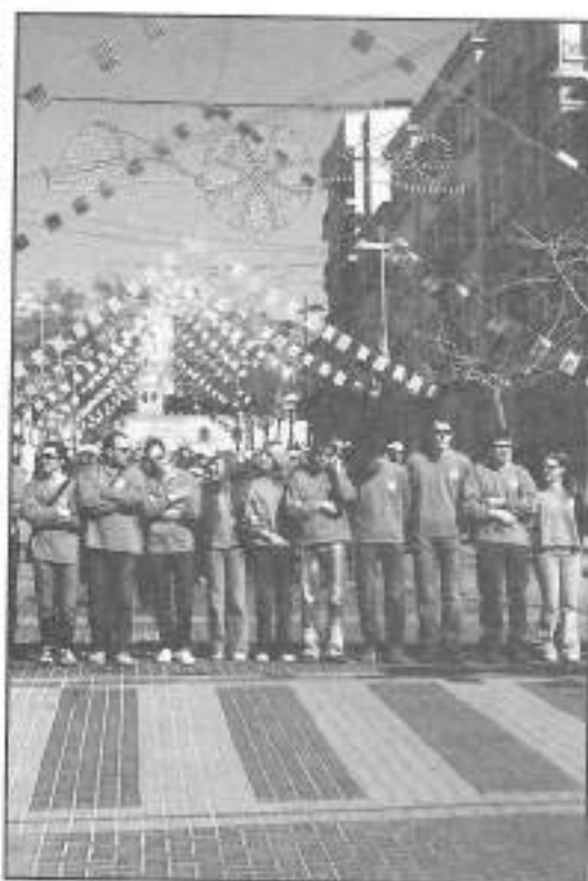
Esquadra del Cavallers del Cid en l'Entrada del Gelador 19-2-2005