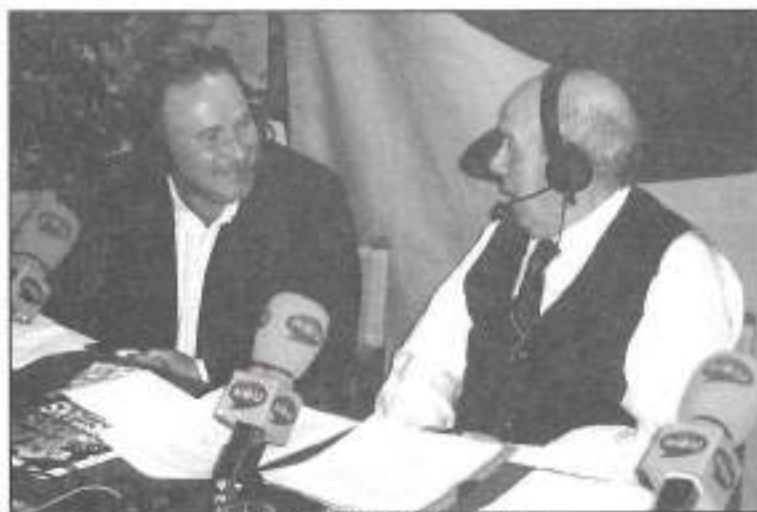
Entrevista amb Radio 9 17-2-2005