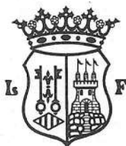
EXCM. AJUNTAMENT DE XIXONA